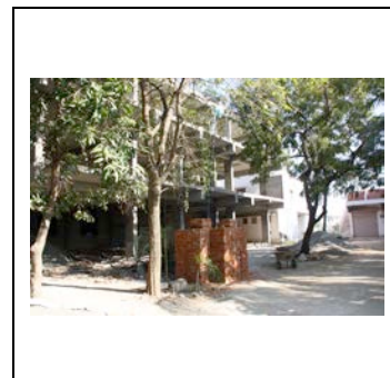
2014 : les murs sont montés.

Si vous souhaitez faire un don, merci de préciser qu'il s'agit de l'aide à la maternité de St Rock's dispensary. Si petit soit-il, il sera le bienvenu et nous sommes garants de son utilisation intégrale pour cette cause.