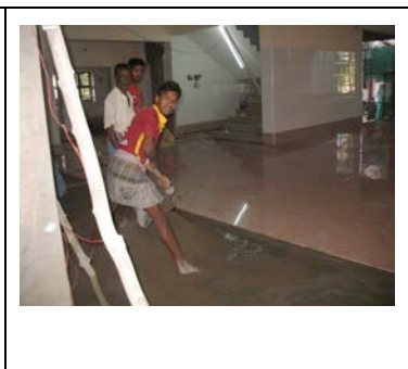
Les carreleurs sont au travail.

..... Le lien avec votre famille : vous allez recevoir par mail la fiche d'entretien, la photocopie du carnet de banque et des photos.