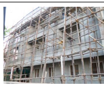
2015 : la façade est crépie, les fenêtres posées.