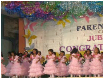
Danse des petites à la fête de l'école