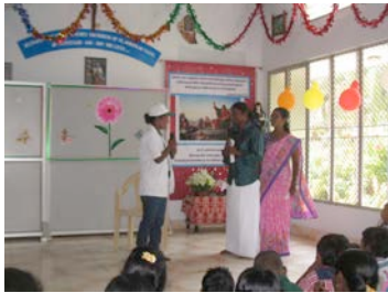
Le festival : Pièce de théâtre avec les mamans