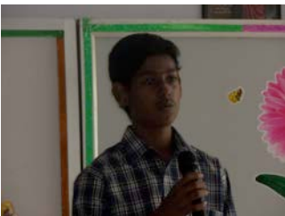
Un grand élève prend la parole pour convaincre les autres enfants de bien travailler à l'école...