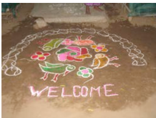
Un très beau Kôlam pour nous accueillir chez KAVITHA.