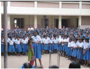
Rassemblement matinal des élèves à l'école de Cluny.